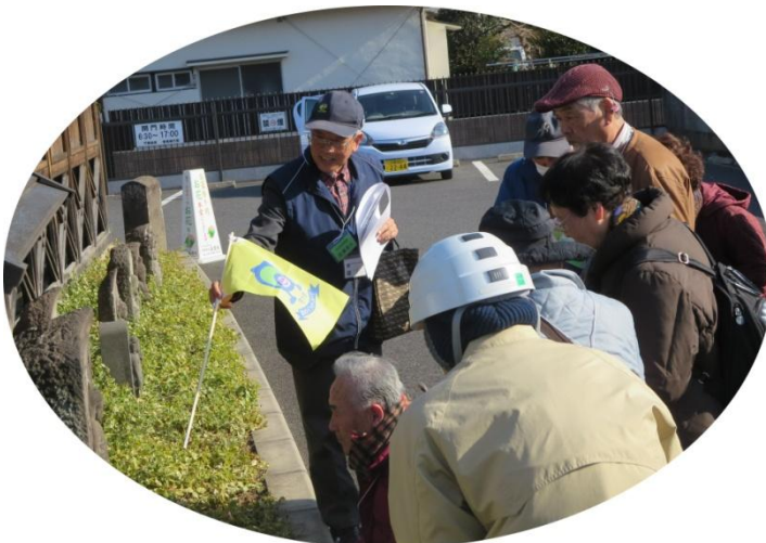
中山道コースでのガイド活動 (遍照院)