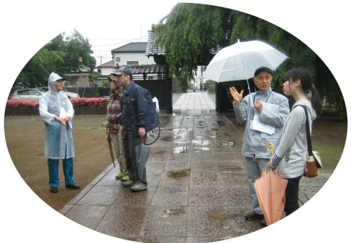
あげお駅からハイキングでの ガイド活動(馬蹄寺)

あげおアップーガイドの会 URL http://appie.html.xdomain.jp/ 〒362-0042 埼玉県上尾市谷津2-1-50 上尾市プラザ22 上尾市観光協会内 (問い合わせは月～金曜日、9～16時) TEL 048-775-5917 FAX 048-775-5024 Eメール info@ageo-kankou.com