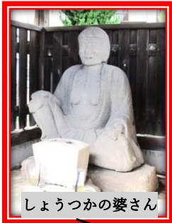
しょうつかの婆さん

かつて人々は現代のような医学に守られず、長寿を願ってさまざまな信仰を重ねてきました。その民間信仰のいくつかを訪ねてみませんか。